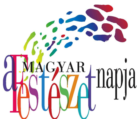
Magyar Festészet Napja