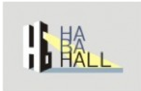
Haba Hall Ingatlanüzemeltető Kft.