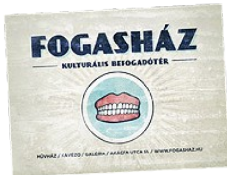
Fogasház Kulturális Befogadótér