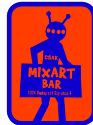
Csak MixART Bar