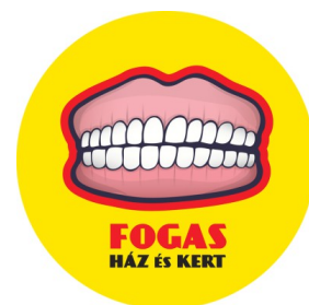
Fogasház Kulturális Befogadótér