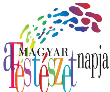
Magyar Festészet Napja